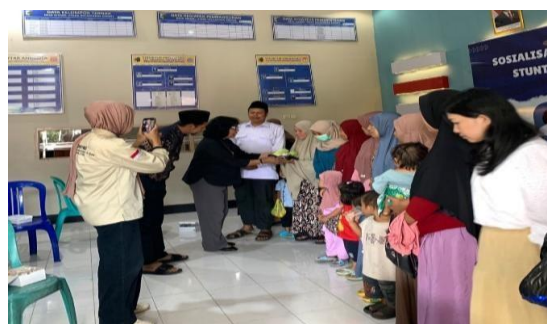
Gambar 6. Pembagian PMT kepada Ibu dari Anak Stunting.

Pemateri menyarankan pemerintah desa untuk memberikan edukasi kepada para ayah sebagai kepala keluarga, melakukan pembuatan makanan bergizi berbahan sumber daya lokal, dan mengoptimalkan peran kader sebagai penganjur kesehatan masyarakat.