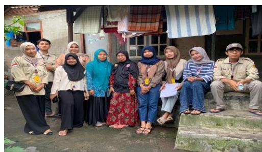
Gambar 2. Survei Lapangan.

Setelah melakukan analisis, hasil survei menunjukkan bahwa 42 dari 47 anak di antaranya mengalami stunting. Diantara 42 data anak stunting terdapat 55% laki – laki dan 45% perempuan. Dari data yang diperoleh, dapat diketahui bahwa 90% penyebab stunting pada anak disebabkan oleh pola makan dan pola asuh orang tua. Dari segi ekonomi, kondisi finansial orang tua anak-anak tersebut tercukupi. Berikut adalah hasil survei anak yang mengalami masalah stunting berdasarkan jenis kelamin.