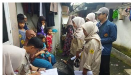
Gambar 1. Survey Data Stunting.

Program kerja utama kelompok KKN yaitu mengadakan sosialisasi stunting dan literasi gizi sebagai upaya untuk menurunkan angka stunting pada anak di Desa Aikmel Utara, serta meningkatkan kesadaran dan pengetahuan masyarakat mengenai permasalahan stunting pada anak di Desa Aikmel Utara. Sosialisasi ini diadakan pada Selasa, 28 Januari 2025 di Aula Kantor Desa Aikmel Utara. Dalam acara sosialisasi ini peserta yang hadir mewakili setiap dusun di Desa Aikmel Utara. Sebelum mengadakan kegiatan sosialisasi, telah dilakukan survei yang bertujuan untuk mengumpulkan data terkait anak yang terindikasi stunting. Berdasarkan data yang diperoleh, selanjutnya dilakukan analisis penyebab terjadinya stunting pada anak di Desa Aikmel Utara.