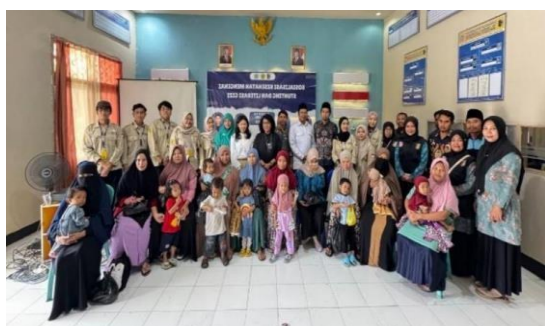
Gambar 3. Sosialisasi Kesehatan Mengenai Stunting dan Literasi Gizi

Dalam kegiatan sosialisasi yang dilakukan sebagai bagian dari penelitian ini, para pemateri dari Universitas Mataram dan STIKES Graha Edukasi Makassar menekankan pentingnya intervensi sensitif, seperti pemberian makanan bergizi berbahan sumber daya lokal, optimalisasi peran kader posyandu, serta edukasi berkelanjutan bagi keluarga. Hasil dari sosialisasi menunjukkan peningkatan kesadaran masyarakat terhadap pentingnya gizi seimbang dalam mencegah stunting.