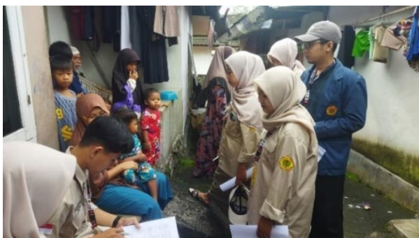
Gambar 2. Survei Lapangan

standar gizi seimbang. Selain itu, tingkat pendidikan ibu berperan penting dalam pemenuhan gizi anak. Ibu dengan tingkat pendidikan lebih tinggi cenderung memiliki pemahaman yang lebih baik tentang pola makan sehat dan pentingnya asupan gizi yang cukup bagi pertumbuhan anak mereka.