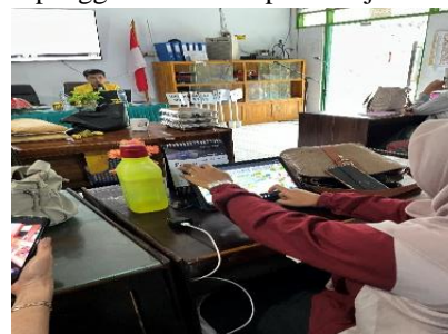
Gambar 3. Praktik Mandiri Penggunaan PhET Simulation oleh Peserta.