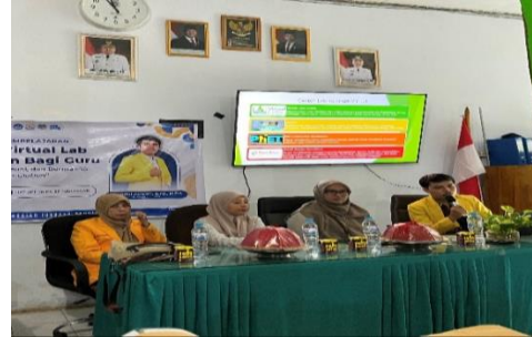
Gambar 1. Penyampaian Materi Pengenalan PhET Simulation oleh Narasumber.

Selanjutnya, pada tahap demonstrasi, peserta diperkenalkan secara langsung dengan fitur-fitur dalam PhET Simulation serta contoh penerapannya dalam pembelajaran. Kegiatan ini memberikan gambaran konkret kepada guru tentang bagaimana simulasi dapat digunakan untuk menjelaskan