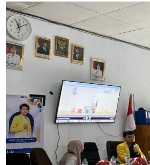
Gambar 2. Demonstrasi Penggunaan PhET Simulation oleh Narasumber.

Hasil yang paling menonjol terlihat pada tahap praktik mandiri. Pada tahap ini, guru secara aktif mencoba berbagai simulasi sesuai dengan mata pelajaran yang diampu. Peserta tampak lebih percaya diri dalam mengoperasikan PhET Simulation setelah mendapatkan pendampingan