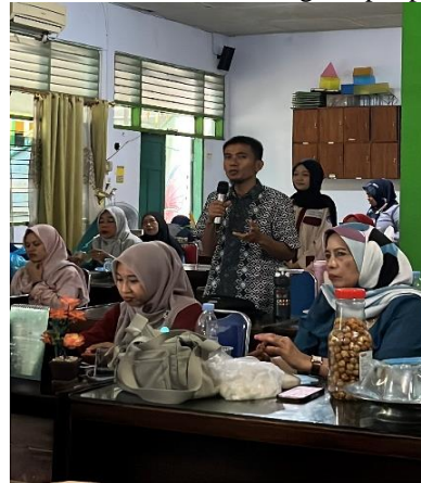
Gambar 4. Kegiatan Tanya Jawab Terkait Penggunaan PhET Simulation.

media pembelajaran yang dapat membantu menjelaskan konsep abstrak serta meningkatkan keterlibatan siswa. Selain itu, terjadi pertukaran ide antar peserta mengenai strategi implementasi PhET Simulation dalam berbagai topik pembelajaran