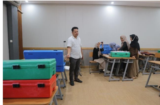
Gambar 6. Penjelasan Terkait KIT.

Penggunaan KIT praktikum yang tepat juga membantu peserta dalam memahami konsep fisika secara lebih konkret dan aplikatif. Dengan demikian, pelatihan tidak hanya meningkatkan kompetensi individu, tetapi juga berdampak pada peningkatan kualitas pembelajaran secara keseluruhan (Arifuddin et al., 2023).