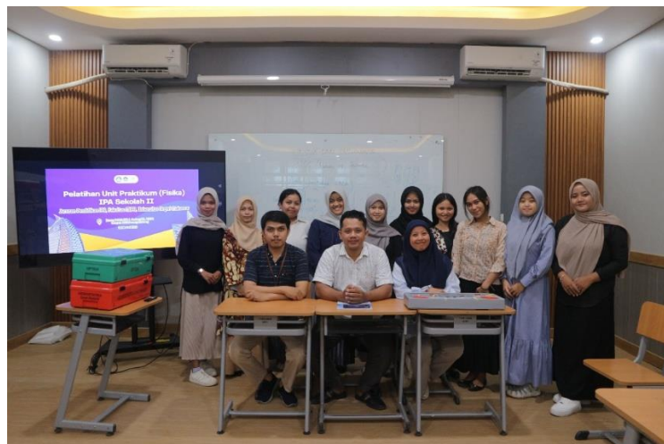
Gambar 1. Dokumentasi Pembukaan Pelatihan.

Kegiatan ini dilaksanakan di ruangan FH IPA 1 Fakultas Matematika dan Ilmu Pengetahuan Alam Universitas Negeri Makassar pada tanggal 5 Februari 2026. Sasaran kegiatan ini adalah asisten praktikum laboratorium IPA yang terlibat dalam pelaksanaan mata kuliah IPA Sekolah II sejumlah 10 orang mahasiswa. Unit praktikum yang diajarkan pada pelatihan ini antara lain tentang pesawat sederhana, jarak benda, bayangan dan titik api, ayunan sederhana serta kalor dan kesetimbangan termal.