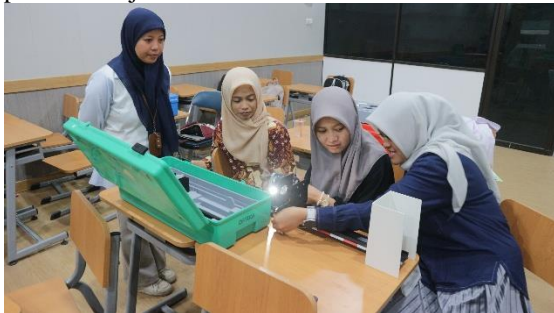
Gambar 5. Pendampingan Pada Penggunaan Alat Praktikum.

Hasil ini sejalan dengan pendapat bahwa pendampingan merupakan bagian penting dalam proses pembelajaran berbasis praktik, karena dapat meningkatkan transfer keterampilan dari pelatih kepada peserta (Saka et al., 2023). Dengan adanya pendampingan, proses pembelajaran menjadi lebih berkelanjutan dan tidak berhenti pada tahap pelatihan saja.