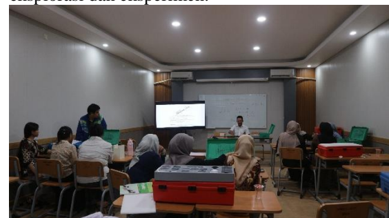
Gambar 4. Kegiatan Demonstrasi Penggunaan Alat Praktikum.

Temuan ini sejalan dengan penelitian yang menyatakan bahwa pelatihan berbasis praktik merupakan metode yang efektif dalam meningkatkan kompetensi tenaga pendidik dan pendukung pembelajaran, terutama dalam bidang sains (Anwar, 2016; Astuti, 2023). Selain itu, keterlibatan aktif peserta selama pelatihan juga berkontribusi terhadap peningkatan hasil belajar, karena peserta tidak hanya menerima informasi secara pasif, tetapi juga terlibat dalam proses eksplorasi dan eksperimen.