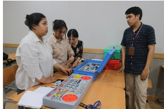
Gambar 7. Memberikan Penjelasan Terhadap Hal yang Tidak Peserta Pahami.

Namun demikian, kendala tersebut dapat diatasi melalui strategi seperti pembagian kelompok kecil, penjadwalan ulang sesi praktik, serta penggunaan metode demonstrasi untuk mengatasi keterbatasan alat. Temuan ini sejalan dengan penelitian yang menyatakan bahwa pengelolaan laboratorium yang baik sangat diperlukan untuk mengatasi keterbatasan fasilitas dan meningkatkan efektivitas pembelajaran (Silka & Karuru, 2023; Rasmianti, 2015).