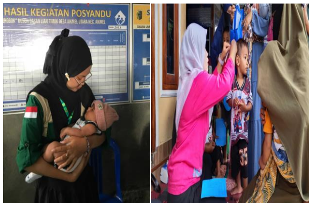
Gambar 2. Kegiatan Pelaksanaan

Evaluasi dilakukan melalui analisis pre-post test, observasi partisipasi, dan refleksi akhir kegiatan. Peserta menyatakan bahwa sebelumnya mereka belum pernah mendapatkan pelatihan pengolahan alpukat secara khusus untuk pencegahan stunting. Dari hasil refleksi, kader posyandu menyatakan komitmen untuk mengintegrasikan edukasi pemanfaatan pangan lokal dalam kegiatan rutin posyandu. Hal ini menunjukkan adanya potensi keberlanjutan program. Secara teoretis, perubahan pengetahuan merupakan indikator dampak jangka pendek, sedangkan perubahan praktik konsumsi memerlukan pendampingan berkelanjutan (WHO, 2020). Oleh karena itu, kegiatan ini perlu ditindaklanjuti dengan monitoring berkala agar dampaknya lebih optimal terhadap penurunan risiko stunting.