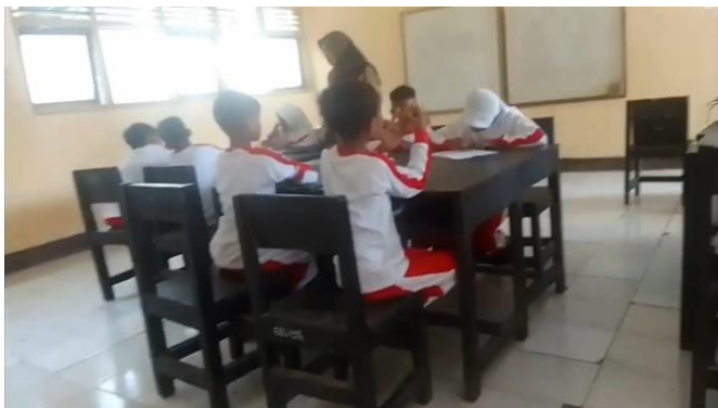
Gambar 1. Membimbing siswa

Langkah-langkah kegiatan pengabdian kepada masyarakat ini mengikuti langkah-langkah model PBL. Aktivitas pembimbingan yang dilakukan oleh guru terhadap siswa dalam kelompok penyelidikan nampak pada Gambar 1, dan karya yang dihasilkan nampak pada Gambar 2.