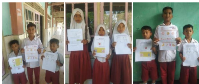
Gambar 2. Karya siswa

Setelah penerapan model PBL di kelas, diperoleh informasi bahwa hasil belajar siswa kelas IV SD Negeri Bombas meningkat dari pertemuan pertama ke pertemuan kedua, yakni dari 30% siswa mencapai KKM pada pertemuan 1 menjadi 95% siswa mencapai KKM pada pertemuan kedua. Hal ini ditunjukkan Gambar 3.